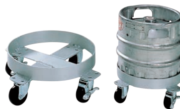
③アルミ 生樽用 台車

458×376×H125 有効内寸:452×370 材質:本体/ポリプロピレン アングル/アルミ キャスター:ナイロン製 φ50 (自在×4、ストッパー2ヶ付) 最大積載荷重:100kg