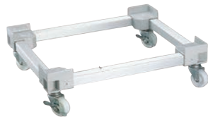
②ビールコンテナ用 台車 AP-No.20

385×470×H160 有効内寸:375×460 キャスター:ナイロン製 φ75 (自在×4、ストッパー2ヶ付) キャスター耐荷重:約120kg ●瓶ビールケースに使用えます。