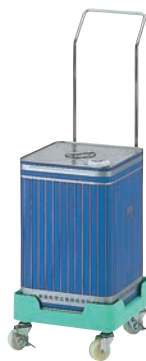
⑥缶きちキャリア ステンレスハンドル付

260×260×H135 有効内寸:240×240×H105(φ275) 材質:ポリプロピレン キャスター:ナイロン製 φ50 (自在×4、ストッパー2ヶ付) 最大積載荷重:60kg ●角型の一斗缶と丸型ペール缶をのせることのできるプラスチック製キャリア