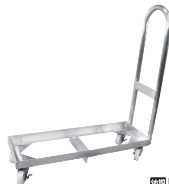
⑦アルミ製 一斗缶台車 H型 3缶用

260×260×H785 有効内寸:240×240×H105(φ275) 材質:ポリプロピレン、ハンドル/18-8 キャスター:ナイロン製 φ50 (自在×4、ストッパー2ヶ付) 最大積載荷重:60kg