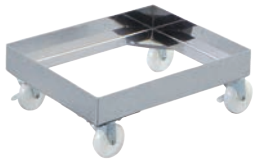
①EBM 18-8 角型キャリア