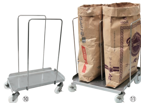
オールステンレス袋キャリア

材質:本体/18-8 ステンレス304 固定ハンドル/18-8 ステンレス304 キャスター:ナイロン製 φ75(自在×4、ストッパー2ヶ付) ●粉袋を直接地面に置かないでキャリアにのせて移動、保管できるため大変衛生的です。 ●前後ストッパーが逆になっているので、粉袋を滑らせて出し入れができます。 ●台車本体、キャスター金具まですべてステンレス304製です。 ●丈夫で洗いやすく、汚れが落ちやすいです。 ●ハンドル固定式 ●HACCP対策に繋がります。