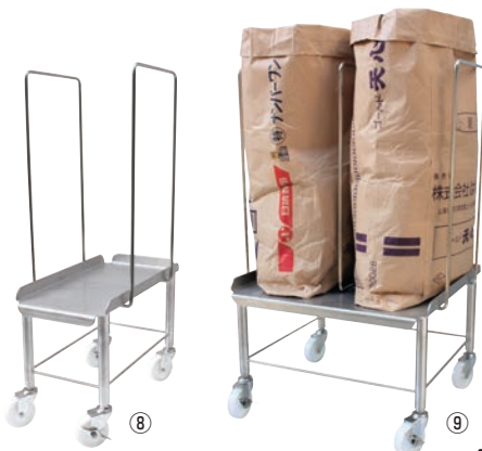
HACCP300オールステンレス袋キャリア

789×254×H878 キャスター:ナイロン製 φ75 (自在×4、ストッパー2ヶ付)